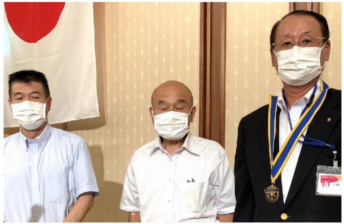
誕生日おめでとうございます！

中島年度58名でスタートしましたが、終了時に65名を達成できるよう、当委員会が先頭に立ち全会員の協力を得ながら活動をしていきます。