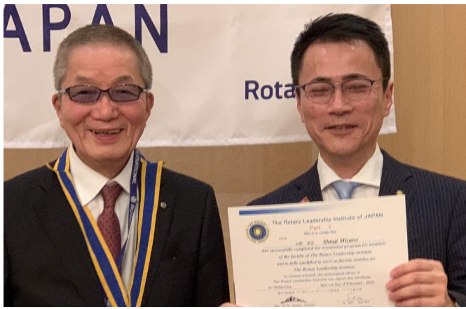
R L I パート1 修了証 水野会員