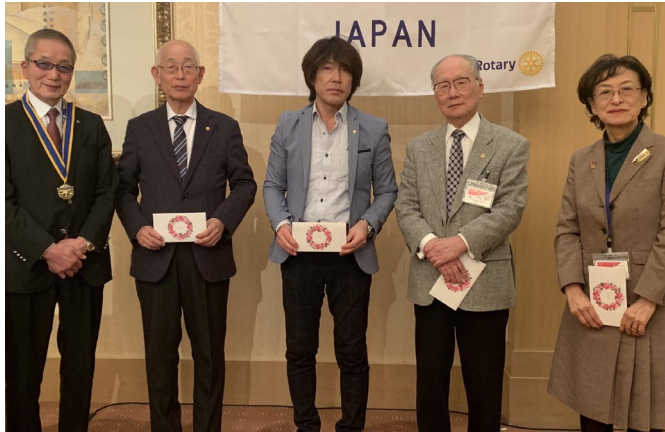
誕生日おめでとうございます！