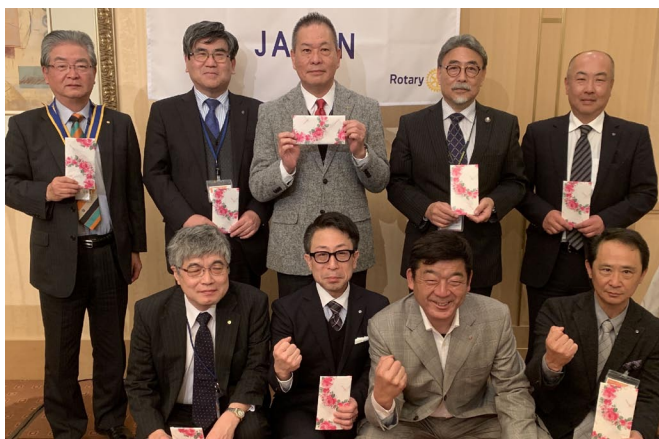
誕生日おめでとうございます！

すいません宇田川です。今回初めて行かせて頂きました。実は2002年頃にうちの父が会長やった時の、向こう社長さんと言うんですけど、会長さんがおりましたんで、ずっと晩餐会とか式典とか、私の隣にいらっやいまして、話は全然弾みませんでしたけども、一応交流というか、させて頂きました。余談ですけども、交流もさせて頂きまして、夜は交流と言うかですね、色々その他の部分の所は全然ありませんでしたので、心配なく。後、本当にこれから行かれる方もいらっやと思うんですけども、私が一番気になったのは、韓国と同じように下水の事情とか紙の事情が悪いんで、ウォッシュレットが無いんですよ。歌劇院とか言って300億近くかけた国の施設があるんですけども、そこも行ったんですけどやはりそこにもウォッシュレットがなくてですね、お尻切れちゃいそうになりまして、その辺だけはちょっと辛い思いさせて頂いたんですけども、他は楽しくさせて頂きました。どうもありがとうございました。