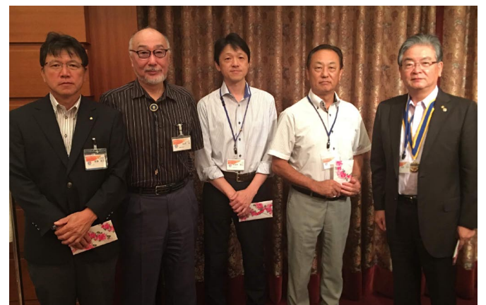
誕生日おめでとうございます！