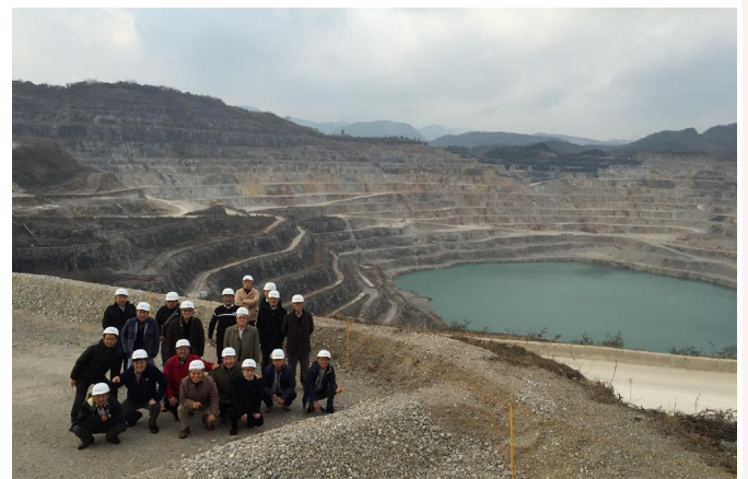
3/2.3 山口県へ職場見学・宇部興産