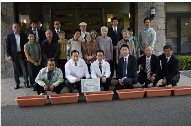
4/20 マザーズガーデン訪問