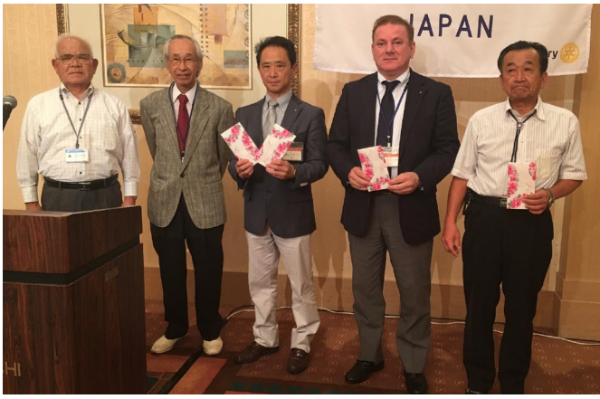
お誕生日おめでとう！