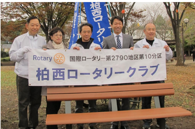
11/23 リバーサイドパークベンチ 3 台寄贈