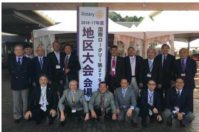
9/25 地区大会 2 日目