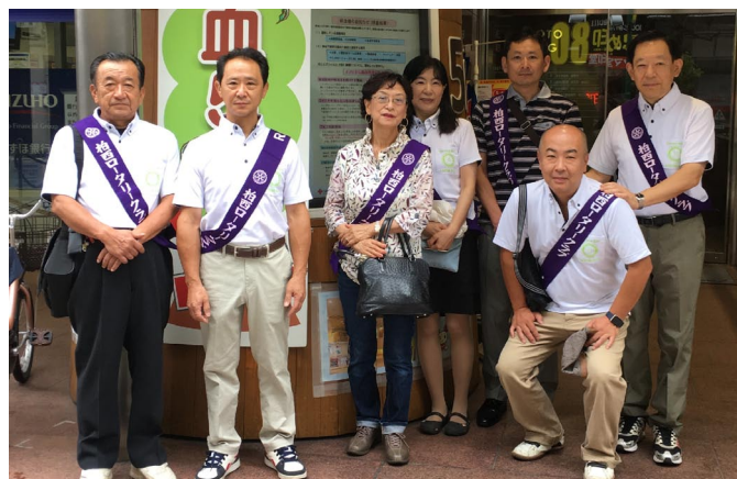
9/11 献血キャンペーン