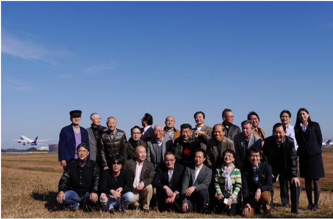
11/18 移動例会 成田国際空港内旧管制塔・滑走路