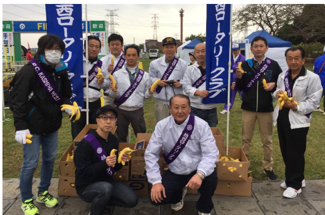
10/30 手賀沼エコマラソン