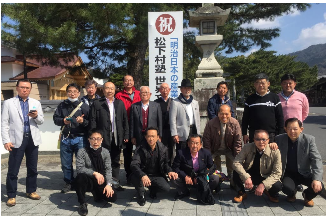
3/2.3 山口県へ職場見学・宇部興産