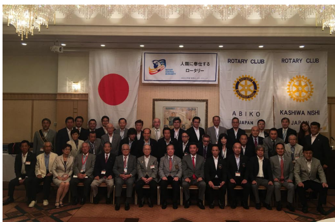
9/2 ガバナー公式訪問