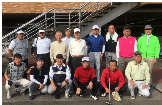
10/14 インターゴルフ 取手国際ゴルフ倶楽部