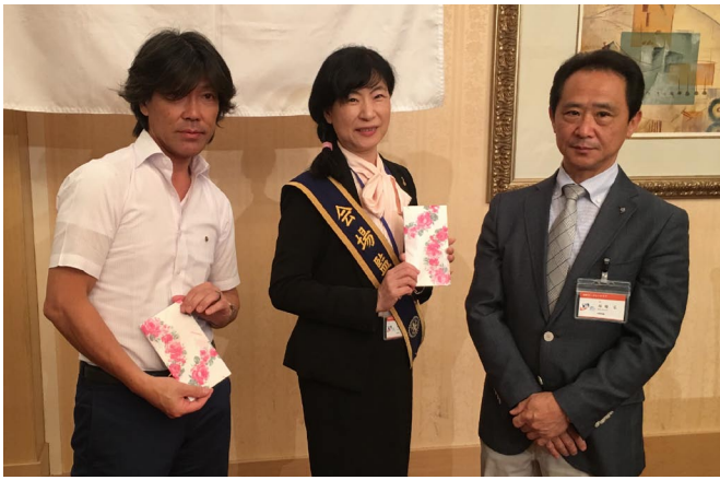
お誕生日おめでとう！