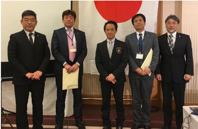
入会おめでとうございます