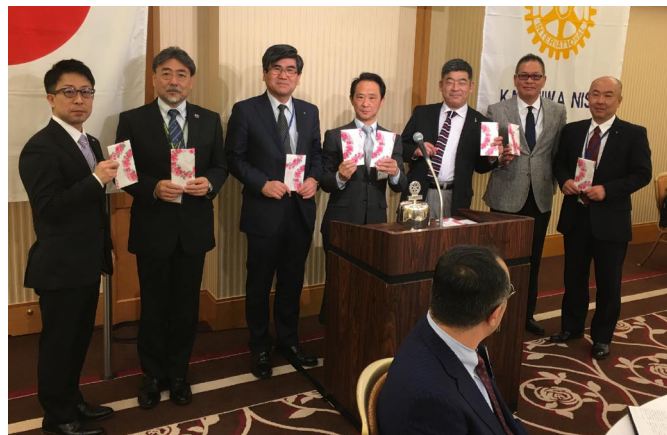
お誕生日おめでとう!