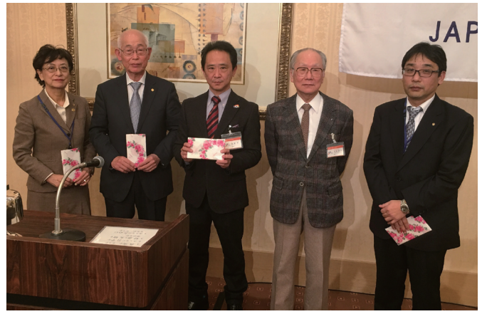
お誕生日おめでとう！