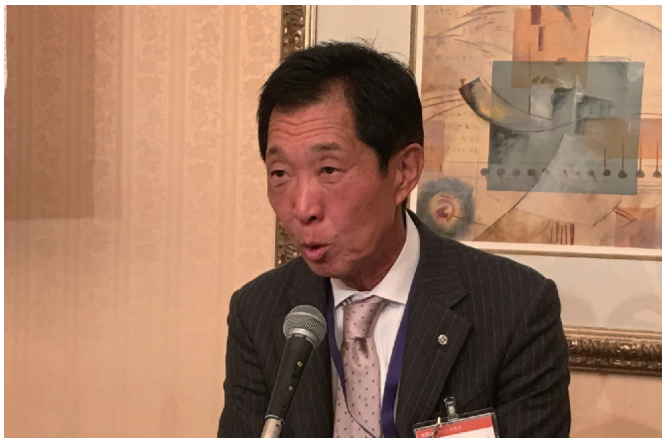
プログラム委員会 金本会員