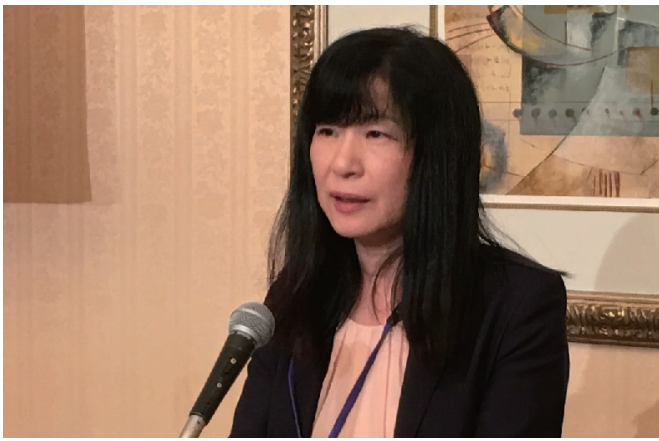
米山記念奨学会 副委員長 住田会員 奨学生・カウンセラー新年会報告