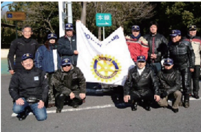
1月18日 第2回二輪車の会 初詣ツーリング