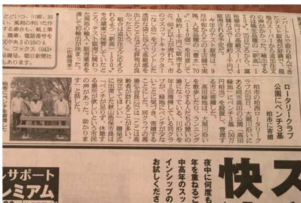
大堀川公園にベンチ寄贈の記事