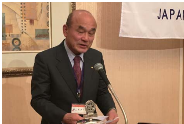
委員会報告 米山記念奨学会 榊会員