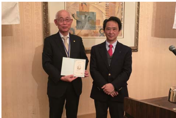
第4回米山功労者 日暮会員