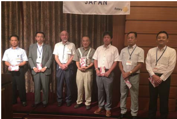
9月 お誕生日おめでとう