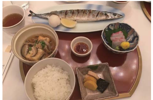
本日のお昼ごはん