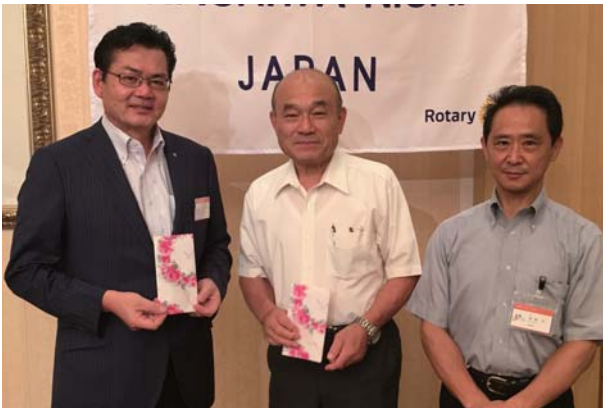
誕生日おめでとう