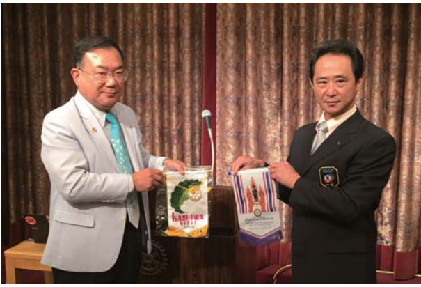
チェンライ RC・柏西 RC バナー交換