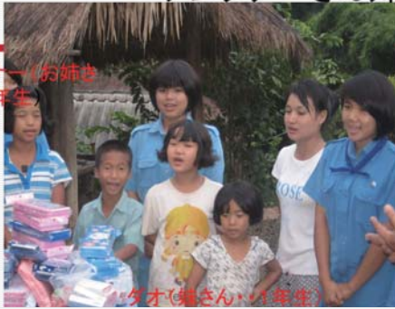
タオ（お姉さん） 1年生

子供たちはフットボールを写真で見ただけだ。ゴミを入れビニールで球状にして広場で駆ける。皆元気だ。それを見る私に副村長さんが「ボールを買う金がない。古くてもいい。本物のボールをこの子らに蹴らしたい」と。