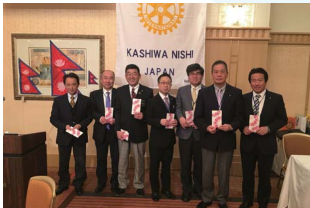
お誕生日おめでとう