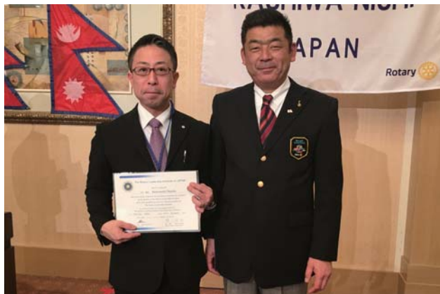
ロータリー・リーダーシップ・研究会の修了証 安田 勝紀