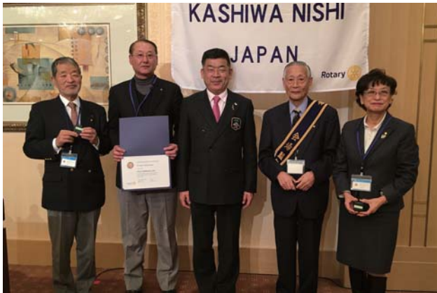
ロータリー財団への寄付者