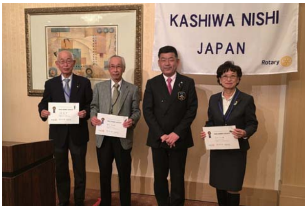
ポールハリス・フェロー・マルチプル授賞