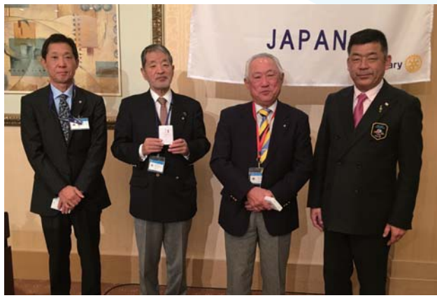
ネパール支援活動 寄付者