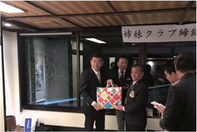
姉妹クラブ締結35周年記念祝賀会風景 城見櫓