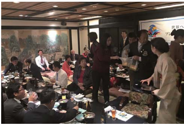
姉妹クラブ締結35周年記念祝賀会風景 城見櫓