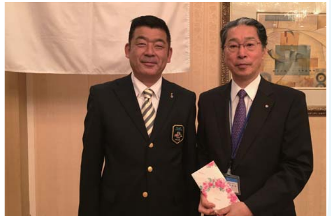
お誕生日おめでとう