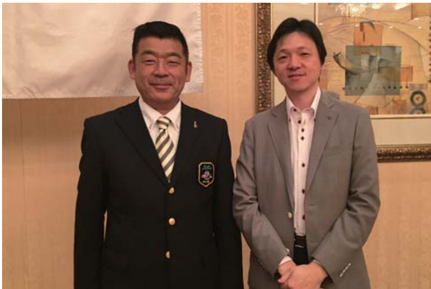
お誕生日おめでとう