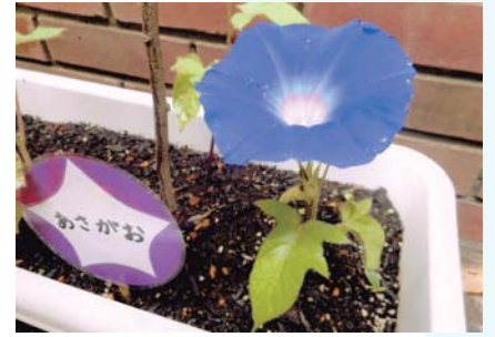
きれいに咲きました！