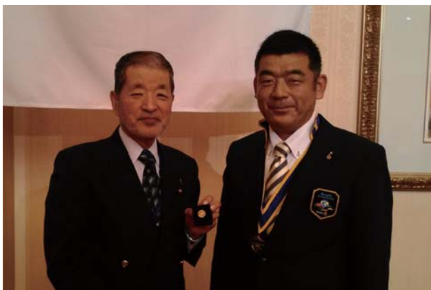
飯合会員 マルチプル PHF (7回目) 表彰