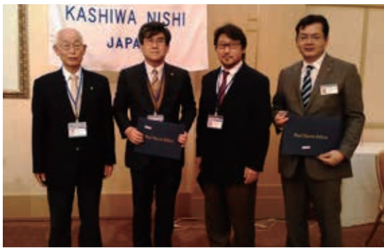
ポール・ハリス・フェロー