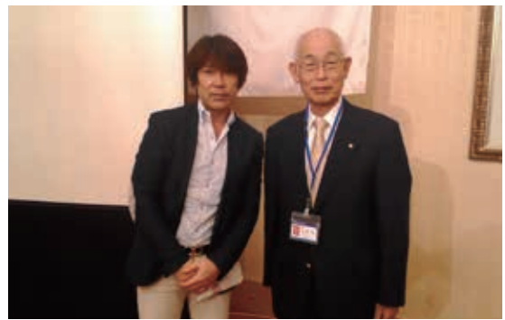
お誕生日おめでとうございます