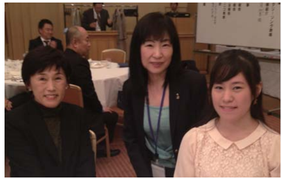
RYLA セミナー参加してきました。