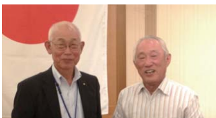
ブービー 川和会員