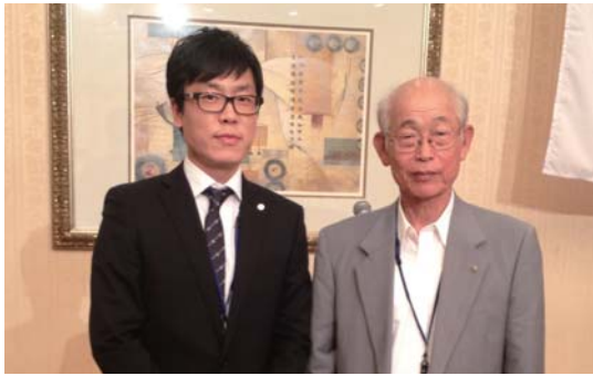
ハンガンミン米山奨学生：奨学金支給