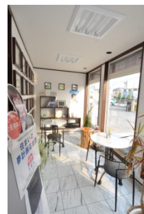
打ち合わせセルーム

地域密着ならではのネットワークを生かし、土地探しからのお手伝いもさせていただきます。そのほかにも地域の賃貸オーナー様とのお付き合いもありますので、賃貸物件のご紹介や管理まで幅広く取り扱っております。