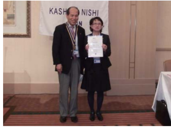
第2790地区 RLI 実行委員委嘱状