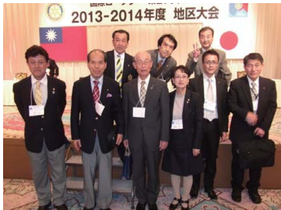
参加者(19名)のうち撮影時は9名