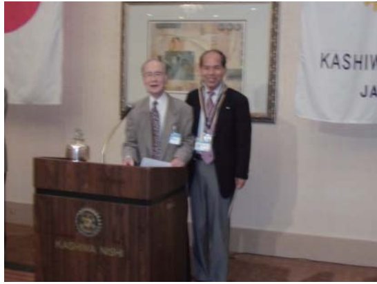
第2790地区 RLI (Rotary Leadership Institute) について説明