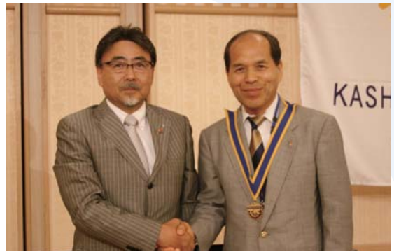
会長引継ぎ (増谷前会長、勝田会長)