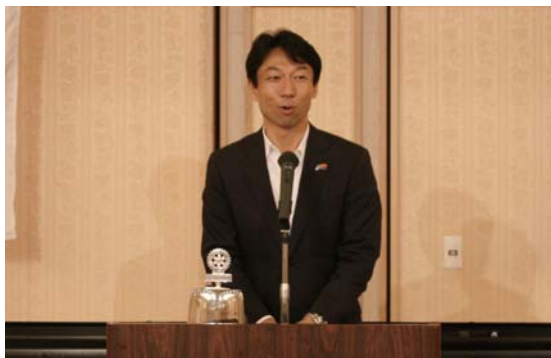
柏市長 秋山 浩保