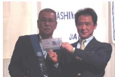
ドラコン 馬場会員