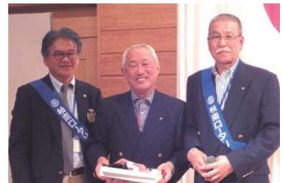
柏南会長賞 川和会員