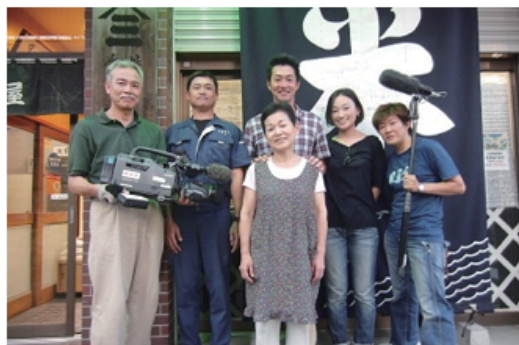
NHK「あさいチ」 月～金 午前8時15分より http://www.nhk.or.jp/asaichi/