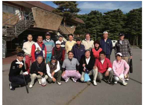
第1回インターゴルフ集合写真