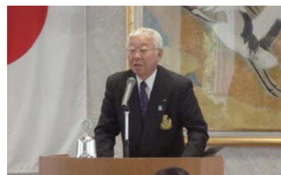
宮ガバナー補佐挨拶