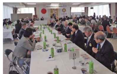
情報研究会の様子