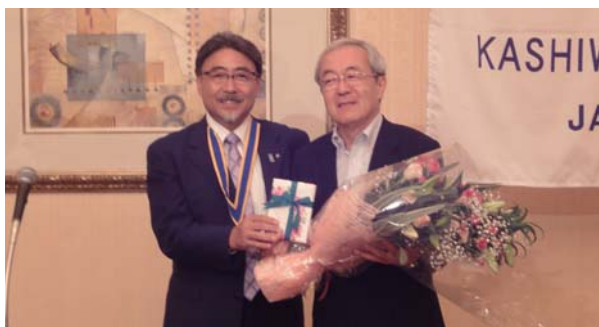
誕生日にケーキと花束のサプライズ (増谷会長、得居ガバナー)