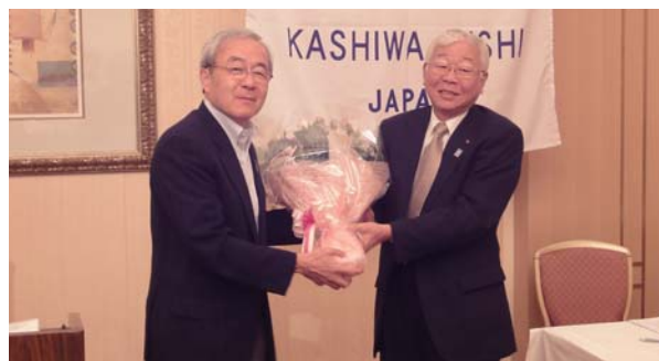
得居ガバナー、宮ガバナー補佐