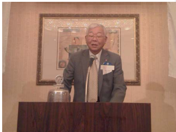
宮 寛 第10分区ガバナー補佐公式訪問