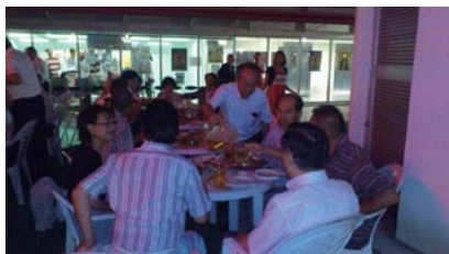
19:00より柏高島屋 屋上ビアガーデン