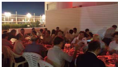
合同夜間例会の様子