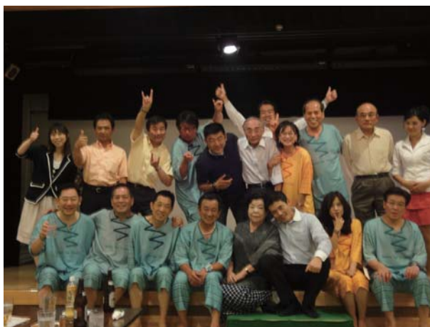
'12歓迎迎会 みのりの湯