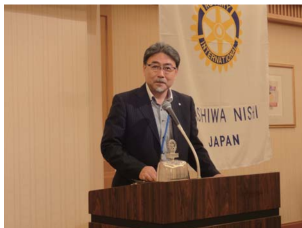
卓話 会長エレクト増谷会員