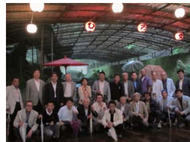
貴船 川床料理ひろ文