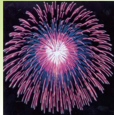
10号玉 三重芯変化菊