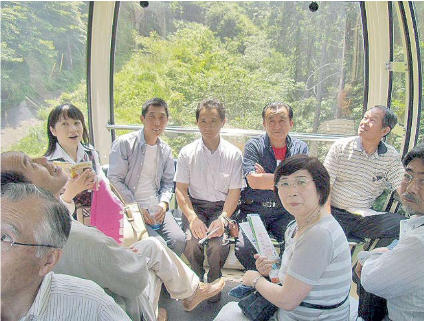
■温泉クロためごをほうばった後、箱根ロープウェイで記念撮影