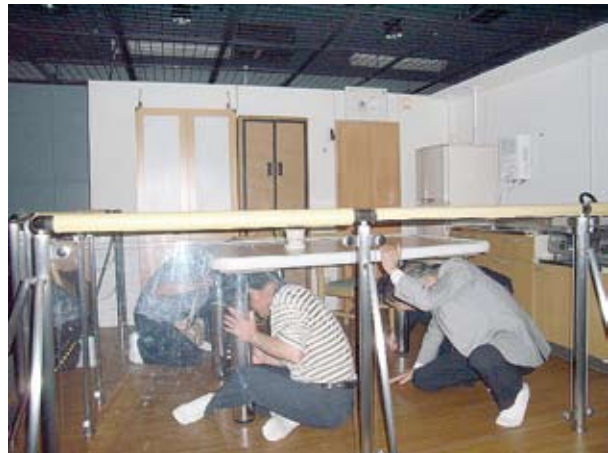
■立川防災センターで震度7を体験中「何もできないすごさ」