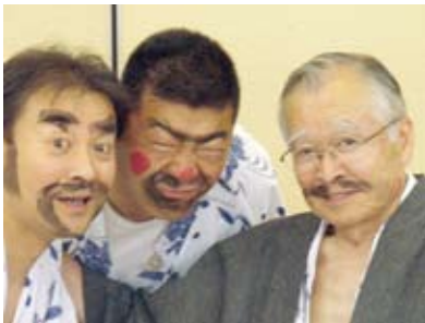
■変装して宴会を楽しむ面々

柏駅東口出発→(株)鈴廣蒲鉾本店→生命の星・地球博物館→箱根登山鉄道→仙郷楼→箱根ガラスの森→星の王子さまミュージアム→立川防災館→立川駐屯地