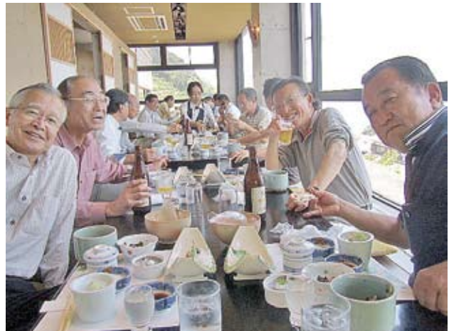
■小田原のそば処でお酒?に舌鼓の各氏