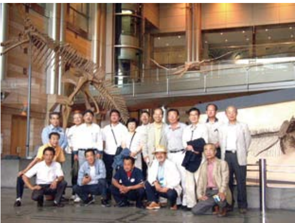
■神奈川県立 生命の星・地球博物館で「はいポーズ」