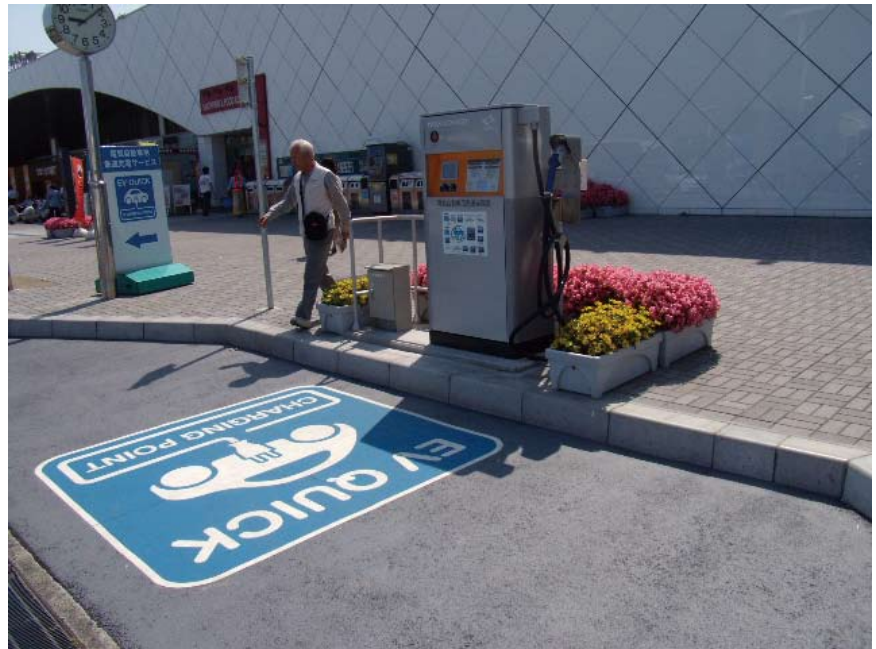
■早くもサービスエリアに登場した電気自動車用充電器