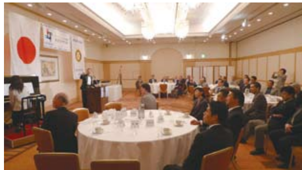
●先生のご指導の下、全員で合唱。

また、東京芸術大学非常勤講師として、学部及び大学院生を指導するほか、音楽環境創造科の声楽の授業も担当した経緯を持ち、現在は演奏活動と共に、東京音楽大学専任講師として後進の指導にあたっている。