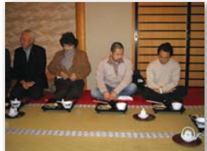
■成田山 新勝寺 境内 精進料理