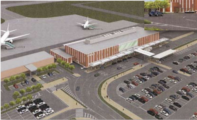
■茨城空港【2010年3月 開港】