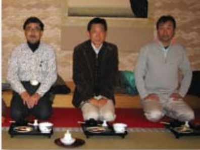
■成田山 新勝寺 境内 精進料理