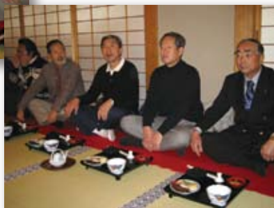
■成田山 新勝寺 境内 精進料理