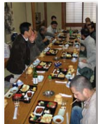
■移動例会 若松本店