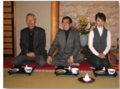
■成田山 新勝寺 境内 精進料理