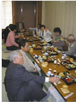
■移動例会 若松本店