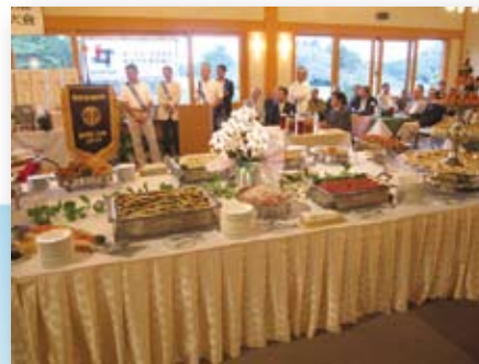
大会を飾るにふさわしい豪華お食事。