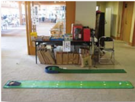
ポリオ撲滅とバター練習で一石二鳥!!