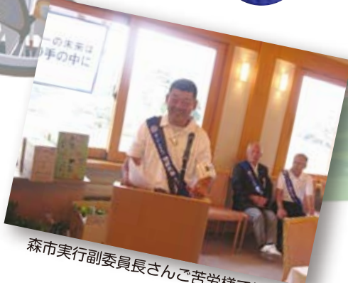
森市実行副委員長さんご苦労様でした。