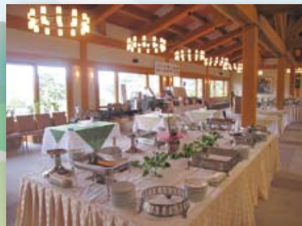
豪華絢爛！セレモニー会場。