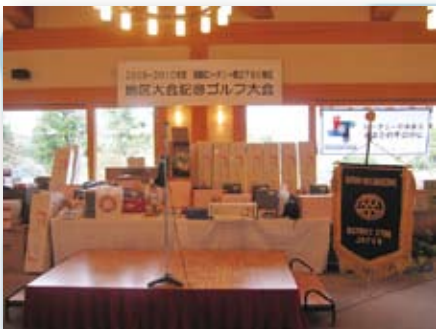
蒼々たる豪華賞品は誰の手に!