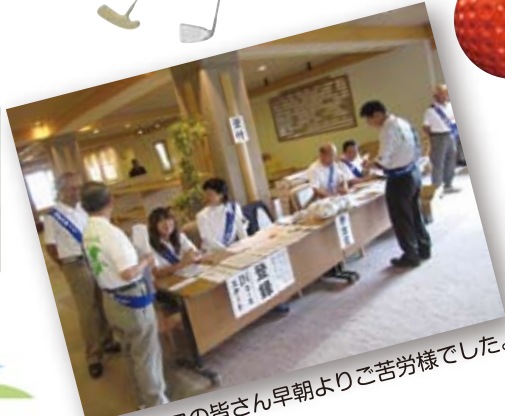
スタッフの皆さん早朝よりご苦労様でした。