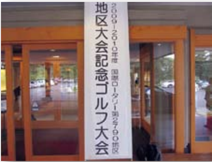
立派な看板がお出迎え