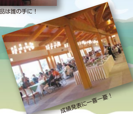
成績発表に一喜一憂!