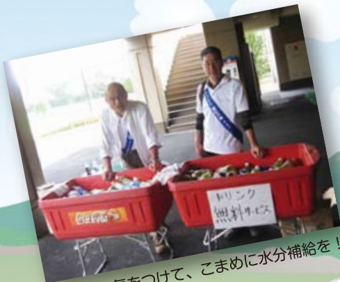
熱中症に気をつけて、こまめに水分補給を！