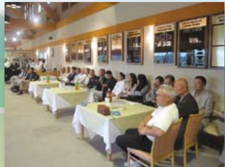
上位入賞は間違いなし!